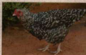
Pedrez ou carijó