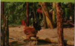
Peri ou Pescoço pelado