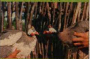
Guiné ou galinha de angola

problema apresentado é a adaptação às condições de clima, manejo sanitário e alimentar. O resgate das raças tradicionais e o incentivo para reprodução das mesmas nos sistemas familiares é a condição fundamental para que a criação de galinha de capoeira continue gerando renda e alimentos para as famílias.