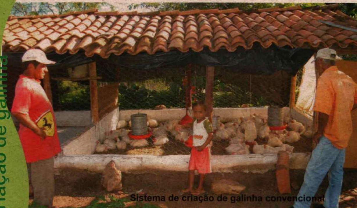
Sistema de criação de galinha convencional

O sistema de modernização da avicultura, que visa apenas à produtividade imediatista vem alterando a forma de manejo da criação de galinha de capoeira feita pelas famílias agricultoras, o que termina fragilizando os seus sistemas produtivos. Nesse tipo de criação convencional, as doenças têm se multiplicado de forma rápida e os animais têm se tornado menos resistentes. Essa proposta de “modernização da avicultura” é conhecida como agronegócio avícola, onde as famílias agricultoras se tornam dependentes de produtos de fora da realidade de suas propriedades. Além de tornar o